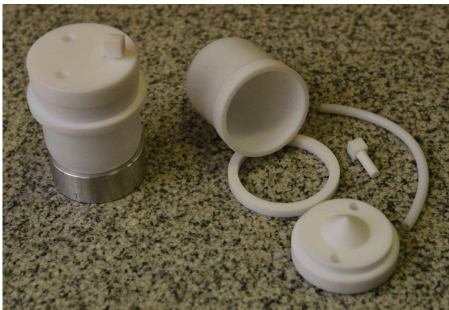
Рис. 1. Фторопластовые стаканы для разложения.

нагревательную лабораторную плиту (ПЛП-03, Томьяналит) с двумя независимыми секциями нагрева и с возможностью программирования режимов нагрева.